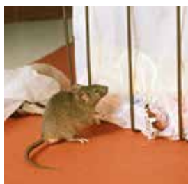
Husmus. Lämna aldrig sopor på marken i området, det drar till sig möss och råttor.