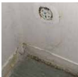
Spår av vägglöss. På dagen håller de till i hörn, bakom golvlister och andra ställen där det är trångt och mörkt.