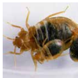
Väggglöss är 1-8 mm långa. De är ljusbruna men blir mörkare när de ätit.