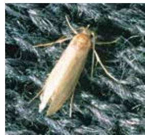
Klädesmalen gillar yllefibrer.