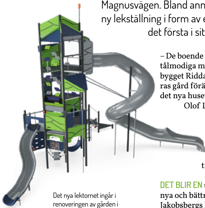
Det nya lektornet ingår i renoveringen av gården i D-området.

Under våren och sommaren rustar vi upp gården vid Husargränd, Drabantvägen och Magnusvägen. Bland annat får gården en ny lekställning i form av ett torn som är det första i sitt slag i Sverige.