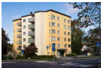
Städet är ett av de områden som har individuell mätning och debitering av vatten, el och värme.

sive moms, och därefter påförs moms. Hittills har våra hyresgäster betalat för sin vattenförbrukning inklusive moms på hyresavin. Skillnaden blir att det anges ett momsbelopp på hyresavin. Slutpriset blir detsamma som tidigare.