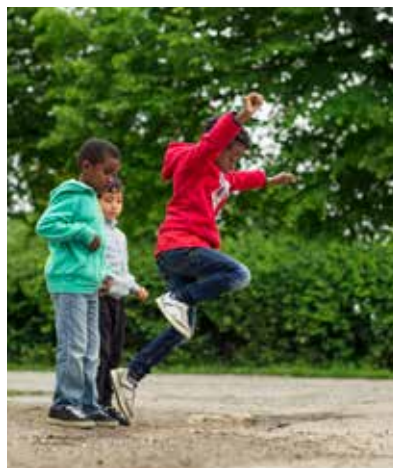
Barnen på Traktor förskola ska göra en bok och en film om deras favoritställen där man kan hoppa, glida och balansera.

I ÅR DELAS stipendiet ut för tolfte gången. På grund av situationen med coronaviruset ställs den traditionsenliga stipendieutdelningen i Jakobsbergs centrum in i år.