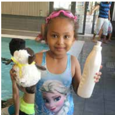
Järfällahus småfiskar har avslutning.

Även i sommar anordnade Järfällahus en subventionerad vattenskola för barnen i våra områden. I det varma vattnet i nya simhallens undervisningsbassäng fick barn mellan fem och åtta år lära sig bli vän med vattnet och ta sina allra första simtag. Vid avslutningen fick föräldrar och syskon komma och titta på. Barnen fick diplom av Järfälla simsällskap, vars duktiga ledare undervisat dem, och en present av Järfällahus. Många lyckades också ta märken. Bra jobbat, småfiskar!