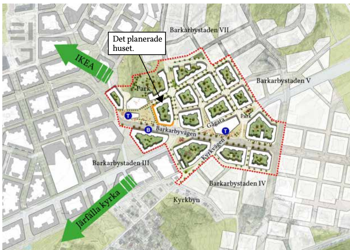
Nära ett torg med både busshållplats och tunnelbanestation inom synhåll planerar Järfällahus att bygga ca 200 nya lägenheter i Barkarbystaden. Orange linje visar var det kommer att finnas lokaler i husets bottenvåning.