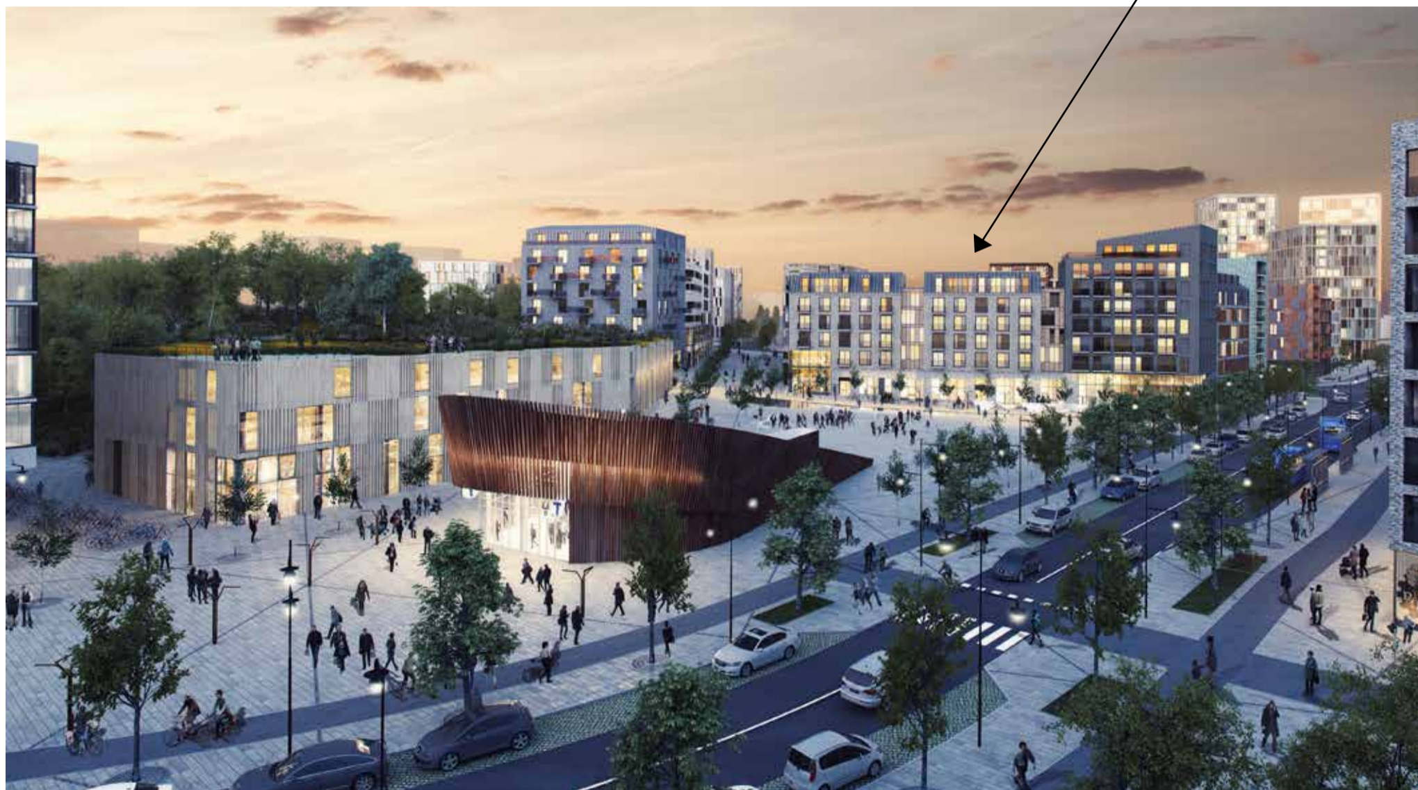
Den här bilden visar en vision av hur det kommer att se ut i Barkarbystaden om några år. Järfällahus kvarter har fasad mot torget. I bottenvåningen syns de upplysta lokalerna för bland annat butiker och restauranger. Till höger syns busshållplatsen. Till vänster finns en gågata mellan husen.