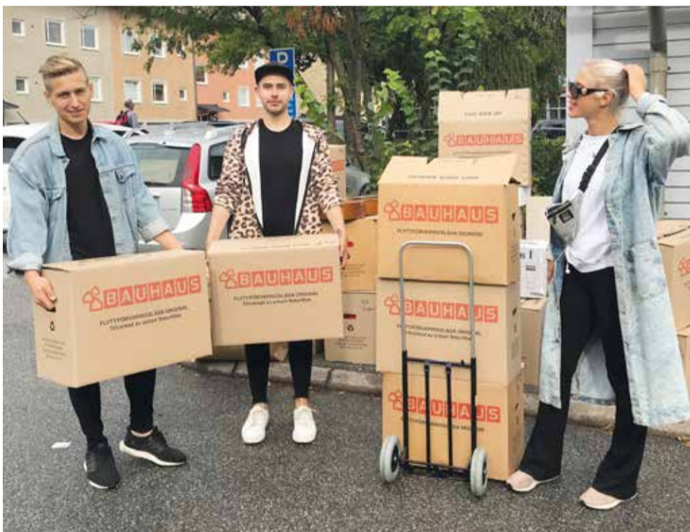
Full fart på inflyttningen. Det är speciellt att få sin första alldeles egna lägenhet. Förutom nycklar och informationsmaterial fick de nya hyresgästerna en inflyttningspresent av Järfällahus och en goodie-bag med mat, städmaterial m m från Coop Nära i Barkarby centrum.

Nu i dagarna färdigställs Huset på höjden, kultur- och aktivitetshuset som Järfällahus iordningställt på Söderhöjden. Hyresgäst i lokalerna är Järfälla kommun, som kommer att driva verksamheten där. Huset innehåller bland annat lokaler för café, konst, musikinspelning, filmvisning, undervisningskök och dansstudio. Lokalerna är tillgängliga för rullstolsburna tack vare nybyggda ramper både utomhus och inomhus.