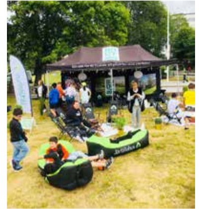
Järfällahus tält och lounge där vi bl a lottade ut air beds under visningarna av fotbolls-VM.

På grund av bl a hård blåst kunde bildskärmen inte flyttas till våra bostadsområden som planerat, men det blev flera välbesökta eftermiddagar och kvällar i Riddarparken i Jakobsbergs centrum istället. Totalt kom 8 100 personer för att uppleva fotbolls-VM tillsammans. Den mest populära matchen var den mellan Mexico och Sverige som drog 1 700 besökare.