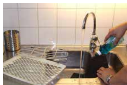
Diska filtret. Alla våra fettfilter kan diskas för hand och i diskmaskin.