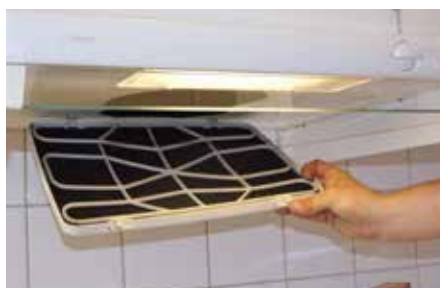
Ta loss filtret. Torka rent bakom filtret, upp i fläkttrumman.

Ett igensatt filter fungerar dåligt och utgör dessutom en brandfara.