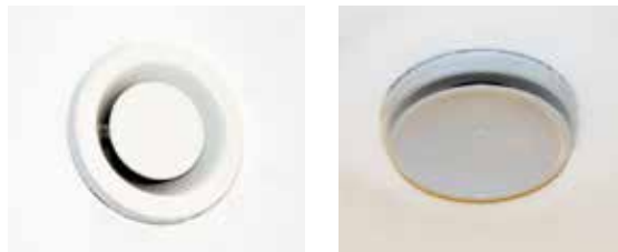
Frånluftsdonen kan se ut på olika sätt. Här syns ett par exempel.

Torka rent ventilationsdonen med torr trasa eller dammsug dem i samband med att du städar.