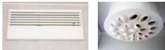
Tilluftsdonen kan se ut på olika sätt. Här syns ett par exempel.

Borsta rent utvändiga ventiler/don med kvast/borste.