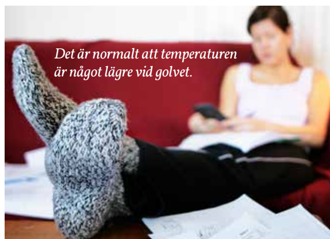
Det är normalt att temperaturen är något lägre vid golvet.