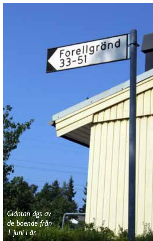
Gläntan ägs av de boende från 1 juni i år.

Rodergränd i Barkarby C kommer inte att säljas. Detta enligt ett beslut som Järfällahus styrelse fattat. Orsaken är att den del av Barkarby C som var aktuell inte lämpar sig att styckas av och säljas på grund av tekniska skäl.