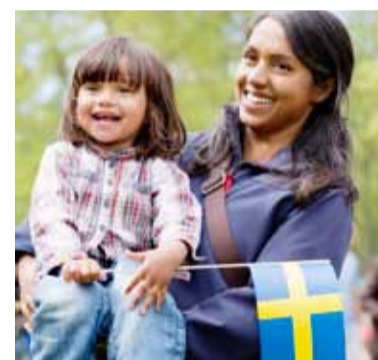
Vid nationaldagsfirandet kan man åka häst och vagn, klappa lamm, shoppa hantverk, prova på segling med mera.

Järfällahus sponsrar också bussar mellan Jakobsbergs centrum och Görväln. Det gör vi för att även du som inte har bil ska kunna komma dit och fira nationaldagen. Bussarna går utanför bussterminalen, hållplatsen närmast Fågelsången, och det är gratis att åka med dem. De går hela dagen kl 11.30-16.00.