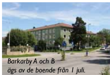
Barkarby A och B ägs av de boende från 1 juli.

De boende i områdena Gläntan, Barkarby A och Barkarby B kommer alltså att köpa fastigheterna där de bor via sina bostadsrättsföreningar. De boende har haft köpstämman, och en majoritet av de boende var för